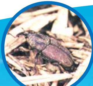
シバオサゾウムシ