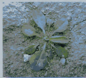
アレチノギク (キク科)