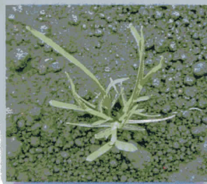
スズメノカタビラ (イネ科)