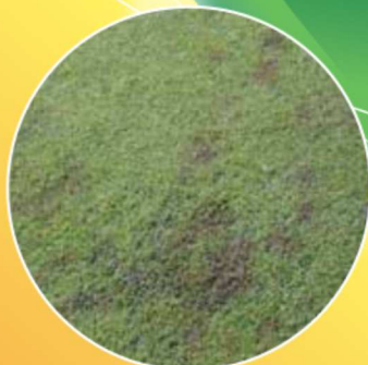
カーブラリア葉枯病