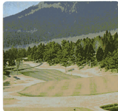
2009.2/7 撒布後16日目 4g/m 2