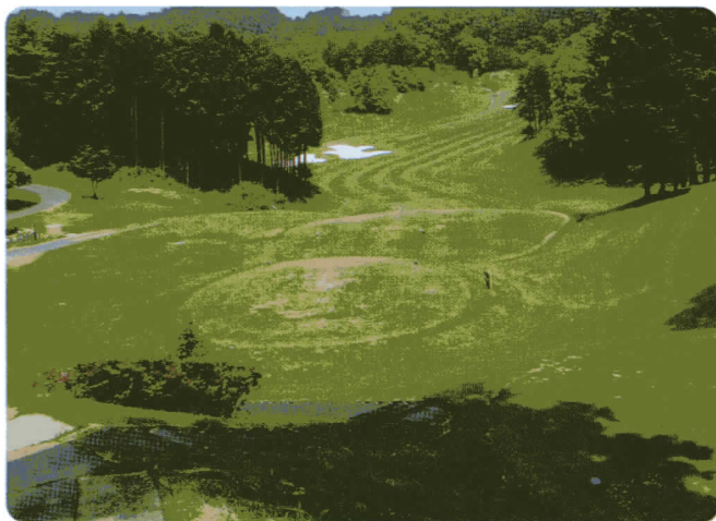
撒布前／5月31日 5g/m 2 2回撒布