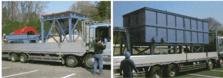
大型トラック2台で回送、設置します。